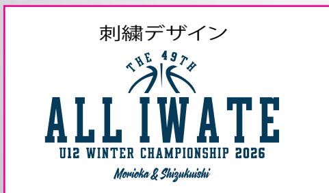
Vネックジャンパー ¥6,300(税込み)