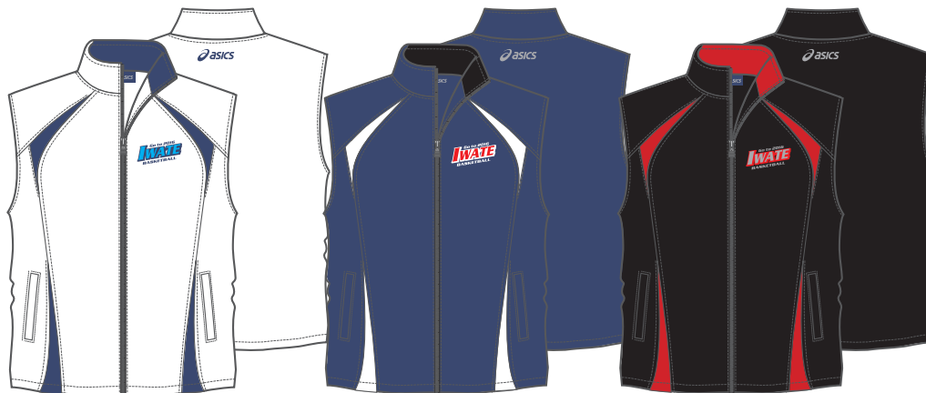
ホワイト X ネイビー